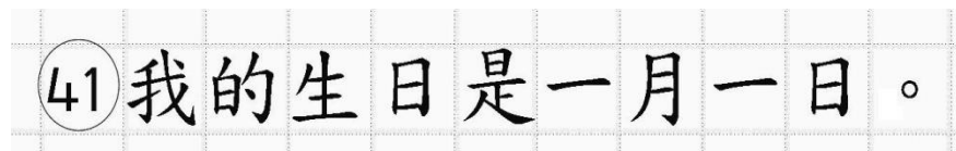
Рис.14. Образец написания иероглифических знаков

иероглифический знак и каждый знак препинания следует писать внутри отдельной клетки области ответов бланка ответов № 2 (дополнительного бланка ответов № 2) (рис. 14).